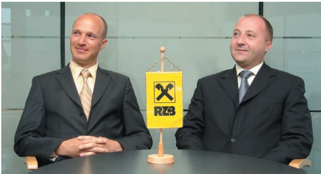
Upravni odbor družbe

Hvaležni za preteklost načrtujemo prihodnost.